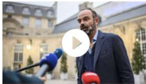
Réforme des retraites : les concessions que pourrait faire le gouvernement